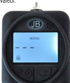
Menu de chargement - Mode de préchauffement

L'appareil affichera "000000" lorsqu'il est à la pression atmosphérique, ou à une pression supérieure à 100,000 microns. Cela indique une condition de surtension. Lorsque la pression est à 100,000 microns ou moins, la jauge affichera la valeur.