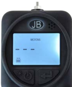
Launch Menu - Aufwärmmodus

Das Gerät zeigt "000000" an, wenn es bei atmosphärischem Druck oder bei einem Druck über 100,000 Mikrometer ist. Dies deutet auf eine Überbereichsbedingung hin. Wenn der Druck bei 100,000 Mikron oder niedriger liegt, zeigt das Messgerät den Wert an.