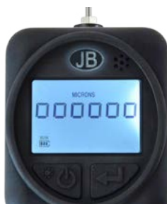
Pressione atmosferica - Modalità di funzionamento normale