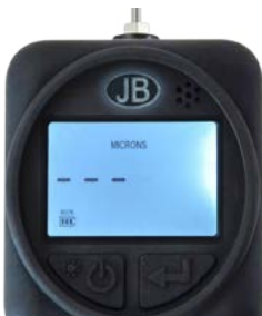
Menu laden - Opwarmenodus

De eenheid zal "oooooo" tonen wanneer het bij atmosferische druk of bij een druk van meer dan 100,000 micron ligt. Dit wijst op een over bereik conditie. Wanneer de druk op 100,000 micron of lager ligt, geeft de meter de waarde weer.